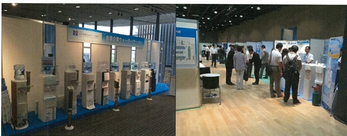
《第3回 宅配水業界交流展の開催風景》

そしてこの度、業界関係各社が一堂に会する国内唯一の場として、「第4回宅配水業界交流展」を開催する運びとなりました。宅配水業界交流展は、安全・安心への希求が益々高まる中、宅配水業界における関連各社の優れた製品や最新技術を展示し、業界内の関連強化ならびに業界のさらなる発展に寄与することを目的としています。当協会の会員・非会員を問わず宅配水業界関連企業様におかれましては、販路拡大、企業間連携の実現、情報交換などビジネス構築の場としてもご活用いただきたいと思いますと考えております。