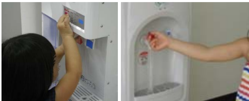
行動調査（チャイルドロックを解除する幼児）