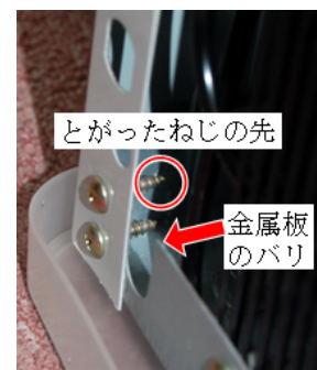
背面にある危険な箇所