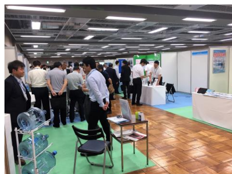
《宅配水業界交流展の会場風景》